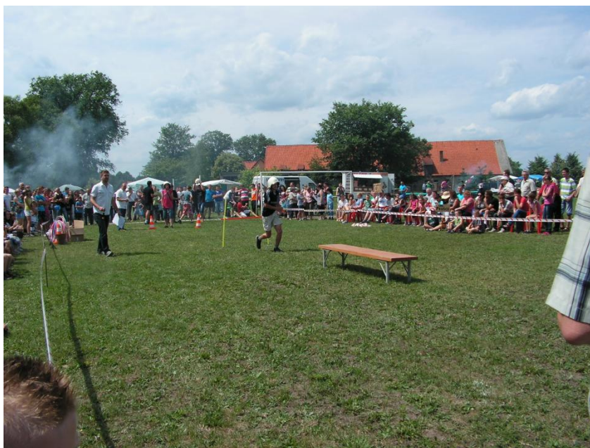
Turniej Wsi Owczegłowy 2012

Obecnie mieszkańcy dojrżeli już do wykonania takich zadań, które będą przyczyniały się do zwartości, integracji mieszkańców. Chcą pracować na rzecz całego sołectwa. Przedstawiony plan jest tego dowodem. Zauważają wagę kultury, sportu, rekreacji i wypoczynku. Całe przedsięwzięcie związane z utworzeniem kompleksu „OCRSW” jest nie lada wyzwaniem, ale mieszkańcy są gotowi do jego realizacji. Będą na bieżąco współpracować z władzami różnych szczebli. Plan zadań, w zależności od postępu prac, będzie uaktualniany i monitorowany. Bieżąca modyfikacja i weryfikacja zaplanowanych działań będzie przebiegała od rozpoczęcia aż do zakończenia prac, a czuwać nad tym będą władze sołectwa w osobach sołtysa i Rady Sołectkiej. Utworzenie „OCRSW” zaowocuje poprawą warunków rozwoju fizycznego dzieci, rozbudzeniem zainteresowań sportowych, a przede wszystkim ogólną integracją mieszkańców. Sąsiedztwo świetlicy pozwoli na organizację dużych imprez sportowych jak i kulturalnych dla mieszkańców sołectwa, gminy i nie tylko. Będzie to również niejako wizytówka sołectwa, które nie miało nigdy możliwości czymś takim się pochwalić. Owczegłowy postrzegają nowopowstające „OCRSW” jako okoliczność sprzyjającą ogólnemu rozwojowi sołectwa, bowiem obfitość obszarów leśnych, bliskość jezior zachęca do szeroko rozumianej turystyki zarówno pieszej, rowerowej jak i konnej.