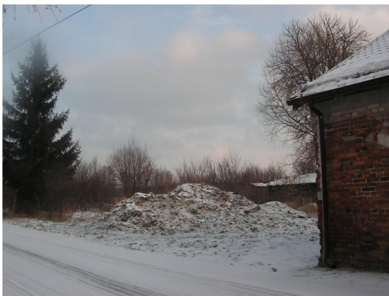
Teren planowanej siłowni zewnętrznej

wano umieszczenie takich przykładowych urządzeń jak: wyciąg górny, wyciskanie siedząc, wahadło, prasa nożna, stepper, narciarz oraz zestaw dziecięcy. Należy podkreślić, że montaż ogrodzenia wraz z betonem niezbędnym do jego osadzenia pozostanie w gestii mieszkańców sołectwa, podobnie transport i montaż urządzeń do siłowni dla starszych. Zadanie to stanowiłoby I etap przedsięwzięcia „Bądźmy aktywni – od juniora do seniora”. W ramach prowadzonej inwestycji zakładany jest cykl imprez promujących aktywność fizyczną wśród dzieci, młodzieży oraz osób dorosłych. Planowany koszt wynosi około 45 000 zł.