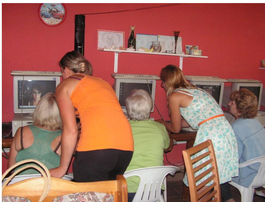
Zajęcia informatyczne dla seniorów przeprowadzone w świetlicy w ramach projektu realizowanego przez Stowarzyszenie „Baranek”

ność fizyczną dzieci. Zajęcia w świetlicy umożliwiają poznawanie i rozwój zainteresowań dzieci. Przede wszystkim jednak kształtują umiejętność współżycia i współdziałania w grupie, ważną nie tylko w dzieciństwie, ale też w dorosłym życiu. Oprócz tego w świetlicy odbywają się spotkania okolicznościowe mieszkańców, wieczory filmowe, prezentacje, przedstawienia, zabawy, dyskoteki i inne. Obecnie świetlica jest świeżo po remoncie wnętrza, został położony również nowy dach. W pierwszym półroczu 2014 planowane jest wykonanie ocieplenia i elewacji. Świetlica jest skomputeryzowana i podłączona do internetu, co prawda komputery wraz z oprogramowaniem nie są najnowszej generacji i w niedługim czasie będą musiały być wymienione, ale na razie spełniają swoją funkcję osuwając dzieci i dorosłych z technologią informatyczną. Świetlica służy również tutejszemu stowarzyszeniu „Baranek” do realizacji celów statutowych oraz przeprowadzania zadań w ramach różnych projektów. Warto podkreślić, iż oprócz niezbędnych do pracy z dziećmi i młodzieżą pomocy dydaktycznych, w świetlicy znajduje się spory księgozbiór, a na półkach wystawione zostały ostatnie trofea sołectwa w postaci pucharów i dyplomów.