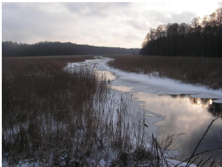
Widok na Małą Wełnę z Mostu Szulca

dowania tego młyna. Postawiony na rzece Mała Wełna most o potocznej nazwie Most Szulca jest dobrym miejscem do obserwacji specyficznego dla tego miejsca środowiska, zwłaszcza do obserwacji ptaków zamieszkujących okoliczne trzcinowiska.