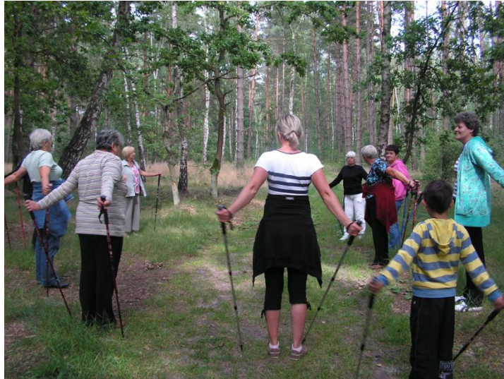
Zajęcia ruchowe – kijki Nordic Walking

Pomnikowa lipa niedaleko Mostu Szulca, czy dalej odbijając w kierunku Siernik, przepiękny park z pomnikami przyrody, może stanowić cel niejednej wycieczki. Fakt usytuowania obiektu w bliskości drogi powiatowej oraz zapewnienie miejsc parkingowych, w tym również stojaków do rowerów, może przyczynić się do wzrostu liczby korzystających zarówno z urządzeń, jak i z części rekreacyjnej lub sportowej. Realizacja przedsięwzięć będzie możliwa przede wszystkim w przypadku otrzymania dofinansowania w ramach Programu Wielkopolska Odnowa Wsi. Powierzone natomiast środki wykorzystane zostaną zgodnie z literą prawa i celem, w jakim będą powierzone. Mieszkańcy solectwa Owczegłowy dołożą wszelkich starań, pracy i sił, aby uatrakcyjnić swoją „Małą Ojczyznę”.