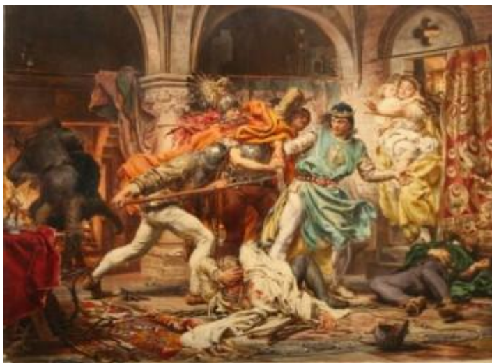
Jan Matejko „Śmierć króla Przemysła II”

chodzą z 1248 roku, a pierwsza wzmianka o kościele św. Wita z 1256 roku. W 16 lat później, tj. 8 lutego 1296 właśnie w Rogoźnie Przemysław II został zamordowany. Fakt ten został uwieczniony przez Jana Matejkę na płótnie „Śmierć króla Przemysła II”.