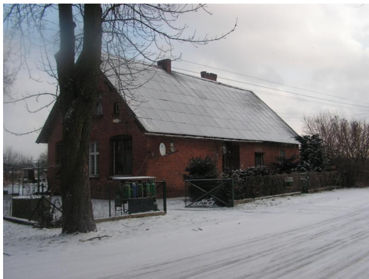
Budynek dawnej szkoły

budynku z czerwonej cegły prowadzone były zajęcia szkolne. Podczas wojny budynek został wykorzystany przez Niemców na zjazdy i zabawy. Po wojnie szkołę ponownie uruchomiono. Oprócz nauki odbywały się tam również zebrania wiejskie.