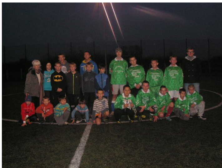
Pamiątkowa fotografia po meczu młodzików Owczegłowy – Pruśce na boisku Orlik