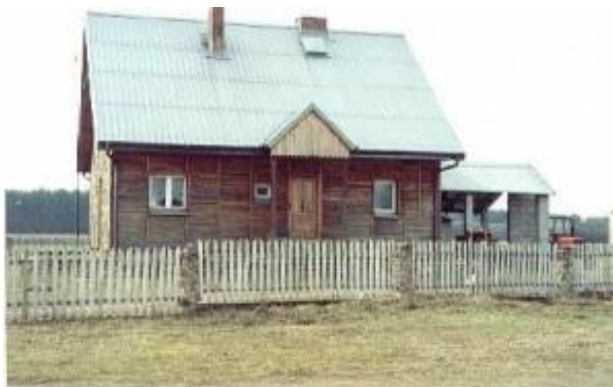
Gospodarstwo agroturystyczne „Pod Dylem” w Owczegłowach

Na terenie sołectwa znajdują się 34 gospodarstwa, z czego dwa są średniej wielkości, natomiast pozostałe to niewielkie, z przewagą ziem niskiej klasy oraz łąk. Tereny łąk i nieużytków są najczęściej przeznaczane pod zabudowę domów rekreacyjnych. Gospodarze, oprócz uprawy żyta i owsa, hodują przeważnie na własny użytek niewielkie ilości krów, świń czy drobiu. We wsi znajdują się dwie prężnie działające stadniny koni. Prowadzą treningi jeźdźców i koni, wychów koni, pensjonat dla koni oraz przygotowujące konie do wystaw i zawodów hippicznych. W Owczegłowach jeden z gospodarzy prowadzi gospodarstwo agroturystyczne, a dzięki dotacji z Unii Europejskiej, hoduje stado liczące 200 sztuk owiec.