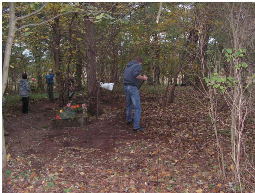
Porządkowanie cmentarza