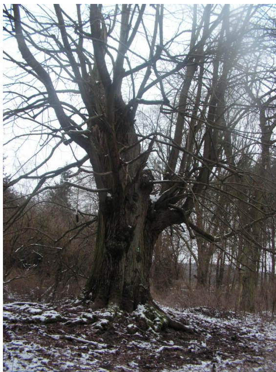
Lipa drobnolistna – pomnik przyrody

stanach sosnowych wprowadzono sztucznie gatunki liściaste, taki jak: buk zwyczajny, klon jawor, jarząb pospolity. W celu zwiększenia różnorodności przyrodniczej posadzono wiele gatunków krzewów, między innymi głogu dwuszyjkowego bezkoralowego, śliwy tarniny, róży faldzistolistnej czy trzmieliny pospolitej. Można tu spotkać takie zwierzęta jak np. jelenia, sarnę, daniela, dzika, lisa, bobra, kunę czy jenota. Widoczne bywają orzeł bielik i rybołów, a także wiele innych, bardziej pospolitych jak dzięcioły, dudki, krogulce, bażanty, które są nie lada atrakcją dla przeciętnego mieszkańca. Lasy zatem rzutują na walory krajoznawcze i turystyczne tego rejonu, bowiem w połączeniu z bliskością kilku jezior są bardzo częstym celem wycieczek rowerowych czy pieszych. Wspomniane jeziora to Jezioro Rogozińskie o powierzchni 148,2 ha i Jezioro Czarne o powierzchni 24,76 ha, są często odwiedzane przez wędkarzy. W terenie został wyznaczony i udostępniony szlak konny o długości około 10 km biegnący w kierunku Jeziora Czarnego.