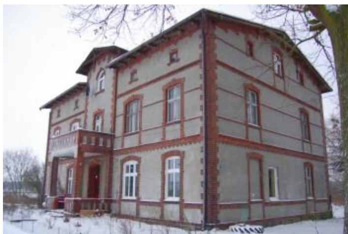
Dom rządcy w Cieślach

Dziedzictwo kulturowe sołectwa Owczegłowy stanowić będzie przede wszystkim znajdujący się we wsi Cieśle „Dom rządcy”, który został wpisany do rejestru zabytków pod numerem A – 444 z 25.07.1983 r. zlokalizowany jest przy podwórzu gospodarczym, kilkanaście metrów od wysokiego brzegu rzeki Welny.