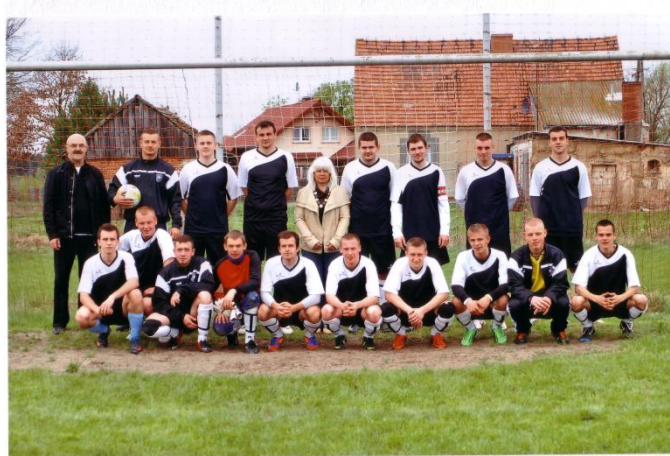
Drużyna piłki nożnej Owczegłowy

Na terenie sołectwa działa utworzone w maju 2011 stowarzyszenie: „Baranek – Stowarzyszenie Na Rzecz Rozwoju i Aktywizacji Społecznej Sołectwa Owczegłowy”. Zostało ono zarejestrowane w Krajowym Rejestrze Sądowym w dniu 11 października 2011 pod numerem KRS 0000398536. Celem Stowarzyszenia jest przede wszystkim podejmowanie działań na rzecz rozwoju Sołectwa Owczegłowy oraz wspieranie społecznej aktywności mieszkańców, w tym w szczególności: promowanie regionu, kultury ludowej, lokalnych tradycji i atrakcji, wspieranie inicjatyw społecznych i gospodarczych wsi, wspieranie dobroczynności i działań humanitarnych, podejmowanie działań na rzecz ochrony środowiska naturalnego, wspieranie inicjatyw społecznych na rzecz budowy nowych i modernizacji istniejących dróg i sieci telekomunikacyjnych, promowanie zdrowego trybu życia oraz podejmowanie inicjatyw w zakresie rozwoju kultury fizycznej i sportu. W 2012 zawiązana została drużyna piłki nożnej seniorów, która uczestniczy w rozgrywkach Gminnej Ligi Piłki Nożnej.