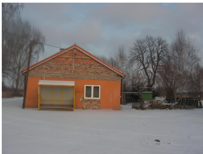
Budynek świetlicy – stan przed położeniem elewacji

2.1. W Owczegłowach znajduje się prężnie działająca świetlica. Prowadzone są w niej zajęcia dla dzieci i młodzieży. Jest ona również miejscem spotkań starszych mieszkańców. Ostatnio wewnątrz świetlicy zostało wyremontowane oraz został położony nowy dach. W I półroczu 2014 roku planowane jest przeprowadzenie remontu elewacji świetlicy wiejskiej wraz z jej ociepleniem.