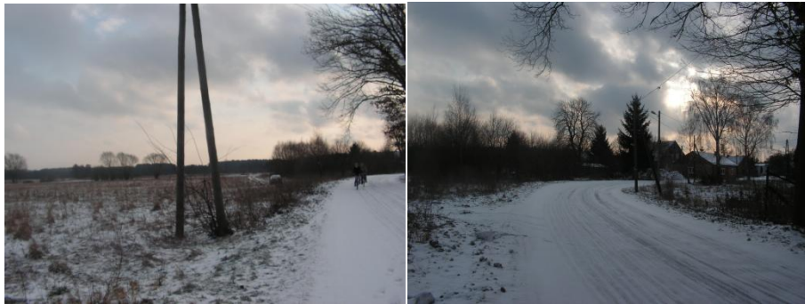
Zdjęcia przedstawiają teren planowanego kompleksu położonego po lewej stronie drogi w kierunku do budynku świetlicy

Cały kompleks „Owczegłowskiego Centrum Rekreacyjno – Sportowo - Wypoczynkowego” w skrócie „OCRSW” będzie ogrodzony, a między poszczególnymi częściami zamontowane będą furtki. Przy planowanym kompleksie planuje się również wykonać miejsca postojowe dla samochodów oraz ustawić stojaki na rowery.