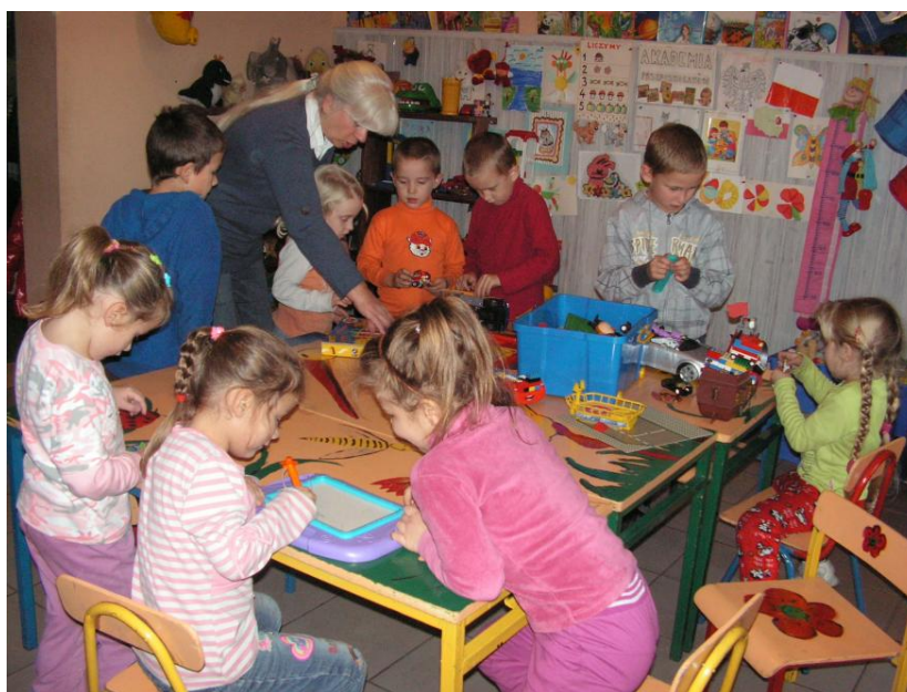
Zajęcia w świetlicy z grupą przedszkolną

Najważniejszym nośnikiem kultury dla tutejszej społeczności jest świetlica wiejska położona w centrum wsi Owczegłowy przy drodze powiatowej prowadzącej z Rogoźna przez Owczegłowy do Wojciechowo i dalej. W świetlicy regularnie prowadzone są zajęcia. Celem działalności świetlicy w Owczegłowach jest zagospodarowanie czasu wolnego dzieci i młodzieży, sprzyjające wszechstronnemu rozwojowi oraz nadrabianiu opóźnień w tym zakresie. Zajęcia wzbogacają wiadomości, rozwijają umiejętności i wychowują. Prowadzone zajęcia dotyczą najbliższego otoczenia dzieci – rodziny, szkoły, kolegów, obejmują wiadomości o miejscu zamieszkania, Ojczyźnie, miejscu Polski w Europie i świecie. Rozwijają zainteresowania przyrodnicze i kulturalne. Uwzględniają również tematykę nawiązującą do dni uroczystych i świątecznych, do zmian zachodzących w przyrodzie w ciągu roku. Podstawową formą aktywności wszystkich dzieci jest zabawa, dlatego dzieci uczęszczające na zajęcia do świetlicy bawią się zgodnie ze swoimi upodobaniami, a są wspierane propozycjami różnorodnych zabaw i gier. Wyzwalana jest w nich aktywność poznawcza i twórcza. Odpowiednio dobrane, ciekawe zabawy i gry wzbogacają wiadomości i doświadczenie dzieci, kształtują umiejętności, angażują emocjonalnie dając okazję do oceniania i wartościowania zachowań.