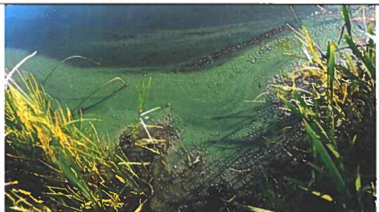
Zakwity sinicowe na Jeziorze Rogoźno w trakcie prowadzonej rekultywacji 22.09.2019 r.