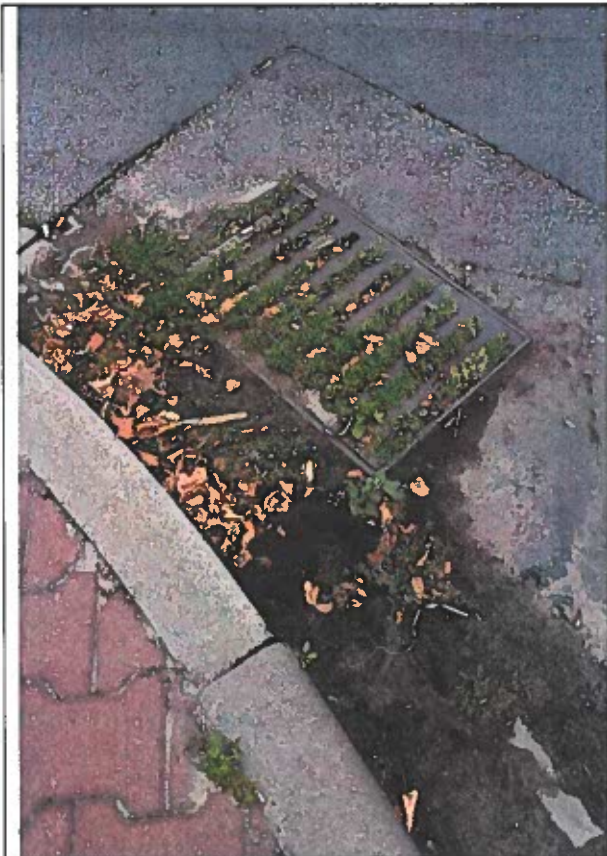
Zatkana kratka kanalizacji deszczowej w samym centrum Rogoźna - 2019.08.01

Wiele kraterów kanalizacji deszczowej w Rogoźnie, nawet w samym centrum, zasypanych jest piaskiem, zatkanych i zarośniętych trawą. Przykładem jest poniższe zdjęcie tej samej kratki wykonane w odstępie prawie roku czasu (01.08.2019r. oraz 06.05.2020r.). Pomimo zgłoszenia tej sprawy do UM Rogoźno w oficjalnym wniosku, sytuacja po prawie roku czasu nie uległa poprawie.