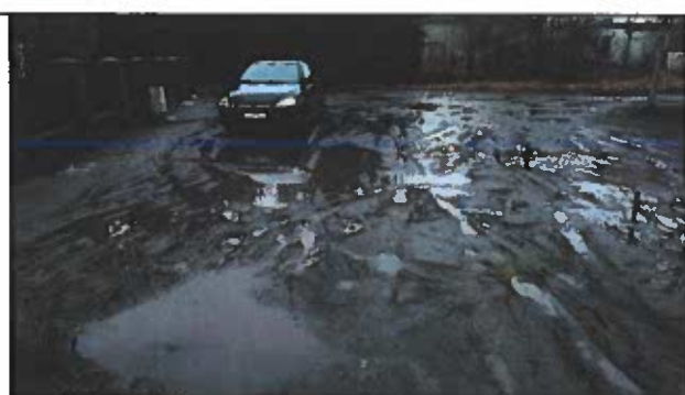
Ulica Różana w Rogoźnie czasie opadów

Należy tu podkreślić, że informacje, o które zwraca się Stowarzyszenie są to dane publiczne, do których prawo wglądu ma każdy obywatel Rzeczypospolitej Polskiej, niezależnie od samorządowych sympatii. W uzasadnieniu wniosku możemy przeczytać, że zgodnie z art. 8 ust. 1 Ustawy z dnia 3 października 2008 r. o udostępnianiu informacji o środowisku i jego ochronie, udziale społeczeństwa w ochronie środowiska oraz o ocenach oddziaływania na środowisko „Władze publiczne są obowiązane do udostępniania każdemu informacji o środowisku i jego