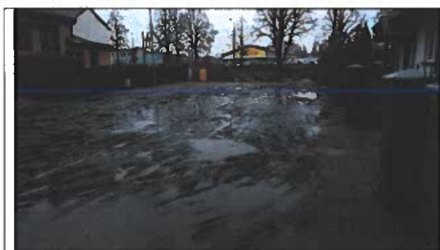
Ulica Różana w Rogoźnie czasie opadów

Ulica Różana w Rogoźnie czasie opadów - źródło: portal FB z 29.04.2020 r.