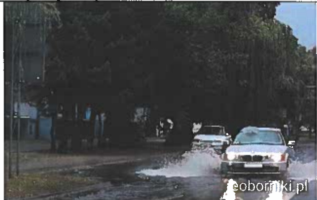
Rogoźno ulica Kościuszki po większych opadach deszczu w 2019 roku