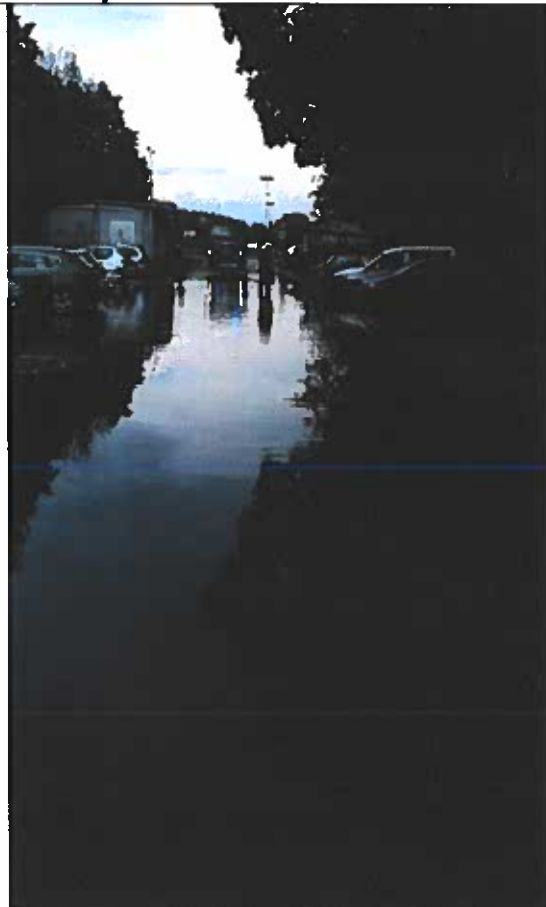
Interwencja OSP Parkowo na ulicy Biskupskiego w Rogoźnie po większych opadach deszczu 2019 r