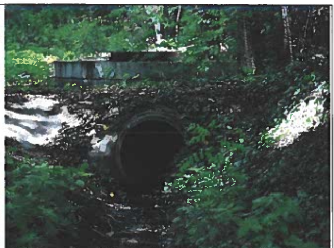
Ujście separatora do Jeziora Rogoźno 03.08.2018. SJR prosi o udostępnienie pozwoleń wodnoprawnych na odprowadzanie wód opadowych z ulic i placów do Jeziora Rogoźno a także dokumentacji eksploatacyjnej potwierdzającej dotychczasowe inspekcje i czyszczenie separatorów.