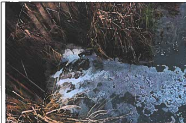
Wylot z oczyszczalni ścieków w Rogoźnie - 03.01.2020 rok - wygląd wypływającej cieczy, piana na wodzie oraz intensywny zapach moczu wskazuje, że w tym miejscu do rzeki Wełny przedostaje się nieustannie duża ilość zanieczyszczeń.

Poniższe zdjęcia prezentują niektóre z wielu niezidentyfikowanych i nieoznakowanych obiektów melioracyjnych w Rogoźnie, które wprowadzają zanieczyszczenia do rzeki Wełny. Należy także nadmienić, że wylot z oczyszczalni ścieków w Rogoźnie, w której wygląd wypływającej cieczy, piana na wodzie oraz intensywny zapach moczu wskazują, że w tym miejscu do rzeki Wełny przedostaje się nieustannie duża ilość zanieczyszczeń.