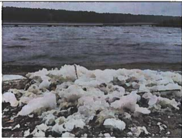
Jezioro Rogoźno - Plaża od strony miasta - 23.11.2019r

Prawidłowe funkcjonowanie kanalizacji ma znaczący wpływ na stan Jeziora Rogoźno oraz rzeki Wełny.