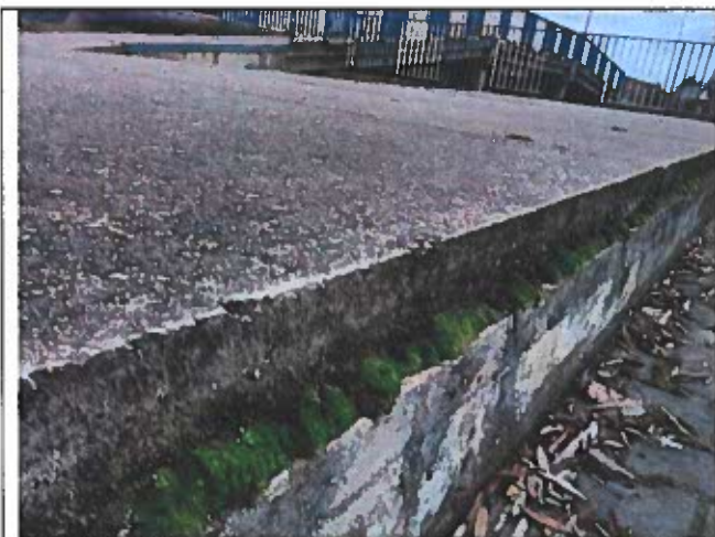
Pokrycie piaskownika przy ujściu Jeziora Rogoźno do rzeki Wełny jest zrudnięta mchem. Stowarzyszenie Jezioro Rogozińskie prosi o udostępnienie dokumentacji dotyczących eksploatacji tego piaskownika oraz informacji wskazującej na sposób wykorzystania piaskownika dla ochrony środowiska. Data: 30.12.2019 r.