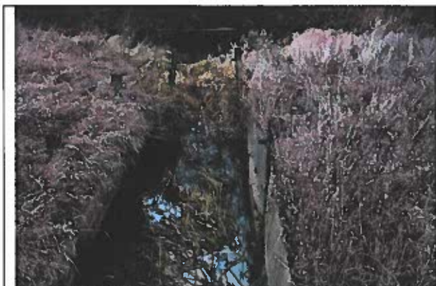
W Rogoźnie znajduje się wiele niezidentyfikowanych obiektów melioracyjnych, które wprowadzają zanieczyszczenia do rzeki Wełny. Przykładem jest poniższy obiekt znajdujący się bezpośrednio przy Halii kolejowej Poznań-PWo - Data: 03.01.2020 rok.