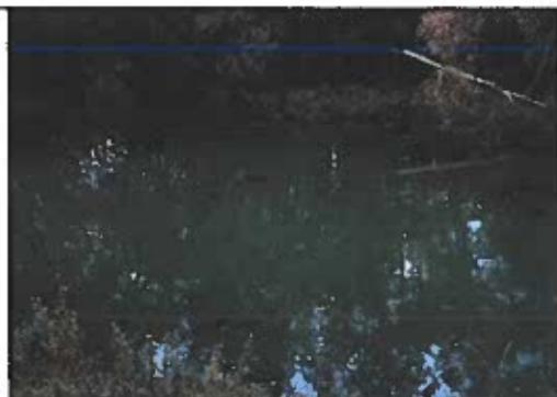
Zakwity glonów na Małej Wełnie pomiędzy jeziorem Budziszewskim oraz Rogoźno spowodowane nieustannym zasileniem dużą ilością biogenów. Data: 09.10.2019 r Według uzyskanych opinii naukowców bez odcięcia dopływu zanieczyszczeń rekultywacja tych jezior będzie bezskuteczna.