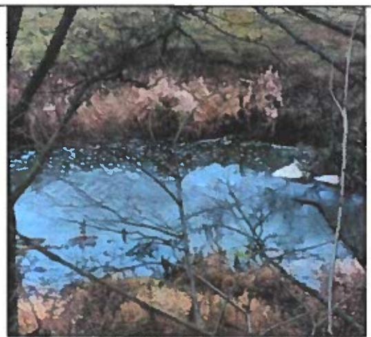
Rzeka Wełna - Przy szpitalu Rehabilitacyjno-Kardiologicznym 3 km przed ujściem wody w Kowanówku k. Obornik - 08.12.2019 r