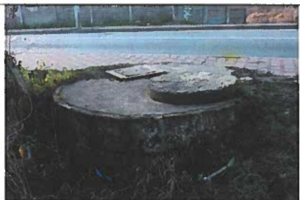
Nieoznakowany obiekt melioracyjny w Rogoźnie na ulicy Lipowej - 02.01.2020r.