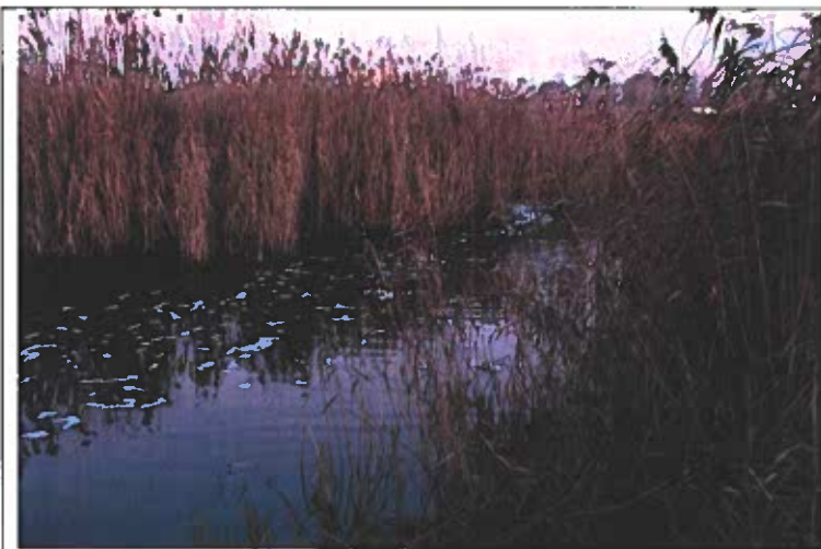
Rzeka Mała Wełna za ujściem jeziora Rogoźno przed wpłynięciem do rzeki Wełny - 02.01.2020 r. W rzece występuje silne zmętnienie, szarzielony kolor wody, gnilny zapach, kożuchy glonów, pojawiają się zakwity sinicowe oraz piana na powierzchni.