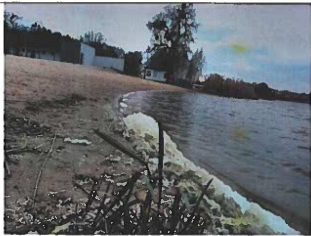
Jezioro Rogoźno Plaża „Ośrodek za Jeziorem” - 30.12.2019r