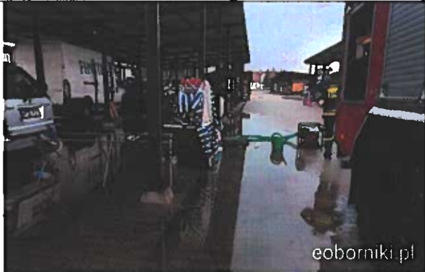
Interwencja OSP Budziszewko na targu w Rogoźnie po większych opadach deszczu w 2019 roku