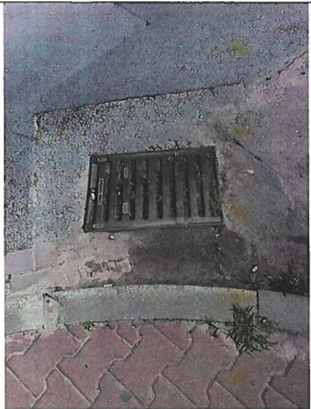
Ta sama kratka kanalizacji deszczowej w samym centrum Rogoźna. Przez prawie rok czasu nie nastąpiła poprawa (studzienka jest nadal zasypana piachem, zatkana i zarośnięta trawą) pomimo tego, że UM Rogoźno otrzymał oficjalne pismo w tej sprawie. Zdjęcie wykonane 6 maja 2020r