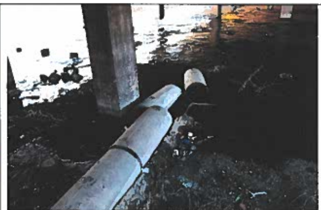
Rogoźno - pod mostem na ulicy Lipowej - 02.01.2020 r.