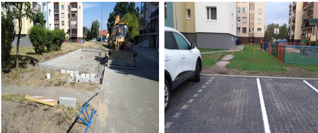
Montaż progu zwalniającego na przejściu dla pieszych na ul. Seminarialnej

Przedsiębiorstwo Budowlano – Drogowe Szymon Włodarczyk Cieśle ul. Potulicka 10/5 64-610 Rogoźno Koszt zadania: 89.691,70 zł.